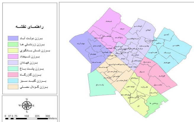
شکل ۲- برزن های تاریخی یزد و زیرمحله های آنها

محل گنبد سبز از چندین محله قدیمی تشکیل شده که هنوز دیوار ارگ حکومتی شهر در شمال این برزن وجود دارد (شمسه، ۱۳۸۵).