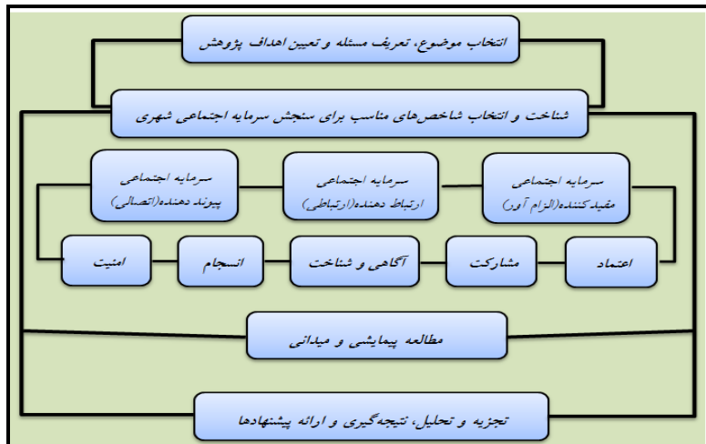
شکل (۱): مدل مفهومی مراحل انجام پژوهش

جمعیت توزیع و مجموعاً ۳۵۰ پرسشنامه تکمیل گردید. در نهایت تجزیه و تحلیل داده‌ها با استفاده از آزمون تی تک نمونه‌ای و تحلیل واریانس انجام گردیده است. سرانجام با توجه به این مطالب، ضمن سنجش و تحلیل شاخص‌های سرمایه اجتماعی شهری، در سطح شهر نسیم شهر، برای بهبود وضعیت، نسبت به ارائه راهکارهای مناسب، تلاش شده است.