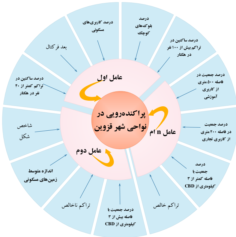
شکل ۱- مدل مفهومی پژوهش