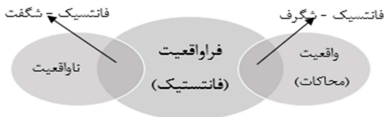
شکل ۱. طبقه‌بندی تودوروف از انواع فراواقعی

«کلارک» ۱ و «هاین لاین» ۲ اشاره نمود و در میان آثار منتشرشده به زبان فارسی «رستم در قرن بیست و دوم» (۱۳۱۳) از «عبدالحسین صنعتی‌زاده» و «نانودیسک» (۱۳۹۸) اثر «آرزو موسی‌زاده» و برای گونه‌ی «فانتزی»، «کنسرو غول» (۱۳۹۷) اثر «مهدی رجیبی» و «بدخون» (۱۳۹۶) از «مهدیس لاورین» (شهریور) و در «ژانر وحشت» داستان «یخ (زاوش)» (۱۳۹۳) از «سینا حشمدار» و نیز «سورمه‌سرا» (۱۳۹۶) از «رامبد خانلری» را مثال زد.