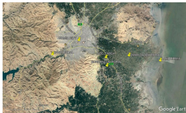
شکل ۱: مکان روستاهای مورد مطالعه

عینیت گفتمان گردشگری روستایی ۱ در حاشیه‌ی شهری ارومیه، باغ ویلاها، خانه‌های دوم روستایی و کافه باغ رستوران‌ها هستند که به صورت گسترده علاوه بر روستاهای هدف گردشگری، در روستاهای نزدیک به آن‌ها نیز گسترش یافته و کارکردهای مختلفی را در باز توزیع سرمایه به همراه آورده است. رواج مشاغل قراردادی کوتاه‌مدت، تبدیل منافع عمومی بیرون از روستا به منافع خصوصی بورژوازی شهری، انتقال ارزش افزوده فعالیت و منابع عمومی به شهر، انتقال حقوق عمومی مبنای منافع عمومی به حقوق خصوصی مبنای منافع شخصی (Wang & et al, ۲۰۲۰) از کارکردهای گفتمان گردشگری روستایی در منطقه‌ی مورد مطالعه است. بر این اساس، فرض بر این است که گفتمان گردشگری به‌عنوان یک کلید در تولید دانش ایده‌آل برای تسخیر فضاهای روستایی، به نفع سرمایه‌داری نئولیبرالیسم عمل کرده و «گفتمان مقاومت» محلی شکل تعیین‌کننده‌ای نداشته است. برای بررسی این مدعا، ما در این نوشتار روی دو موضوع تأکید می‌کنیم: ۱- گزاره‌ها و احکام محلی باغ ویلاها، خانه‌های دوم روستایی