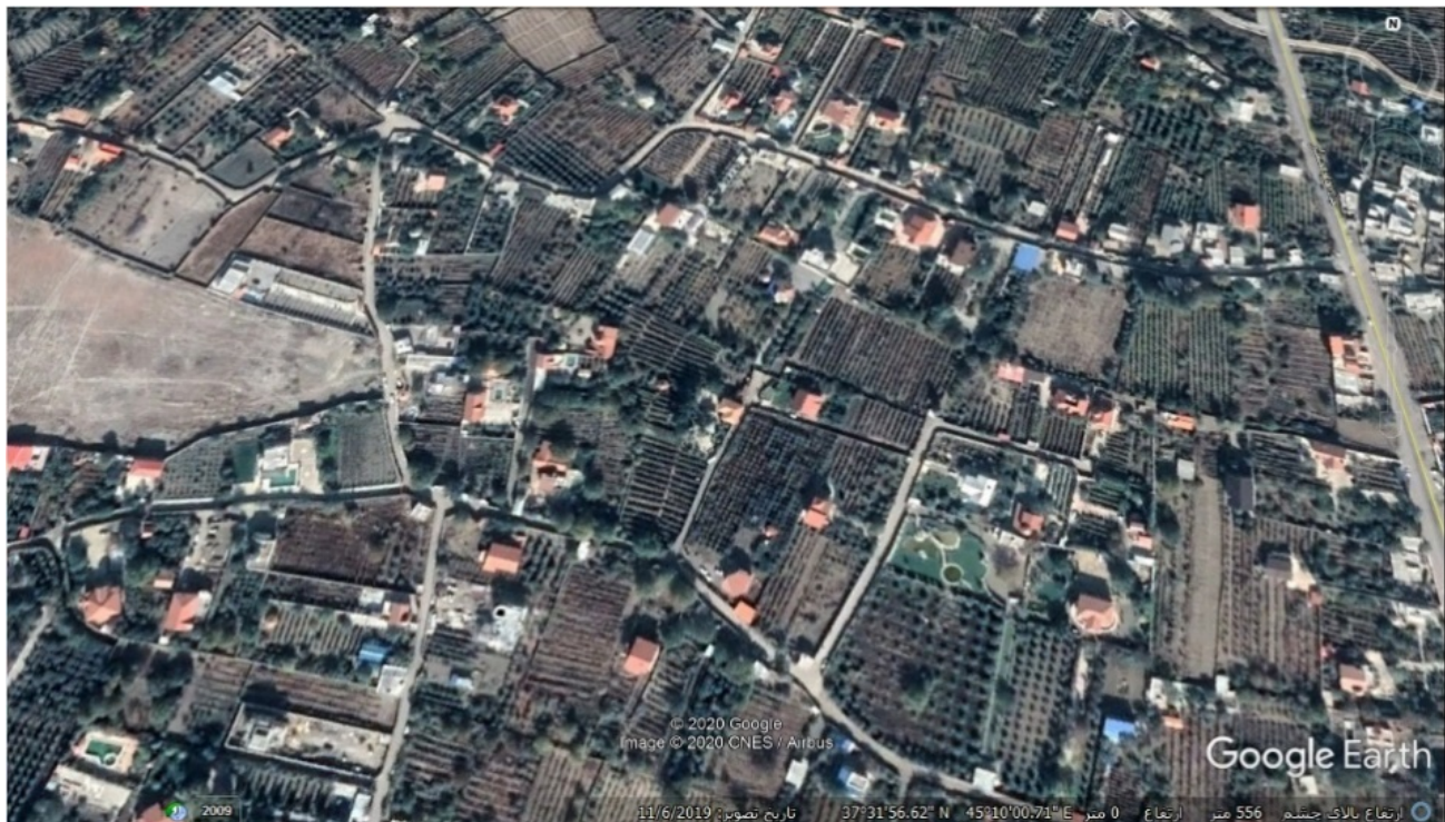
شکل ۲: تصور هوایی از باغ ویلاهای اطراف روستای امامزاده

باغ ویلا و کاه‌رستوران‌های باغی طرد معنایی کارکردی دارند.