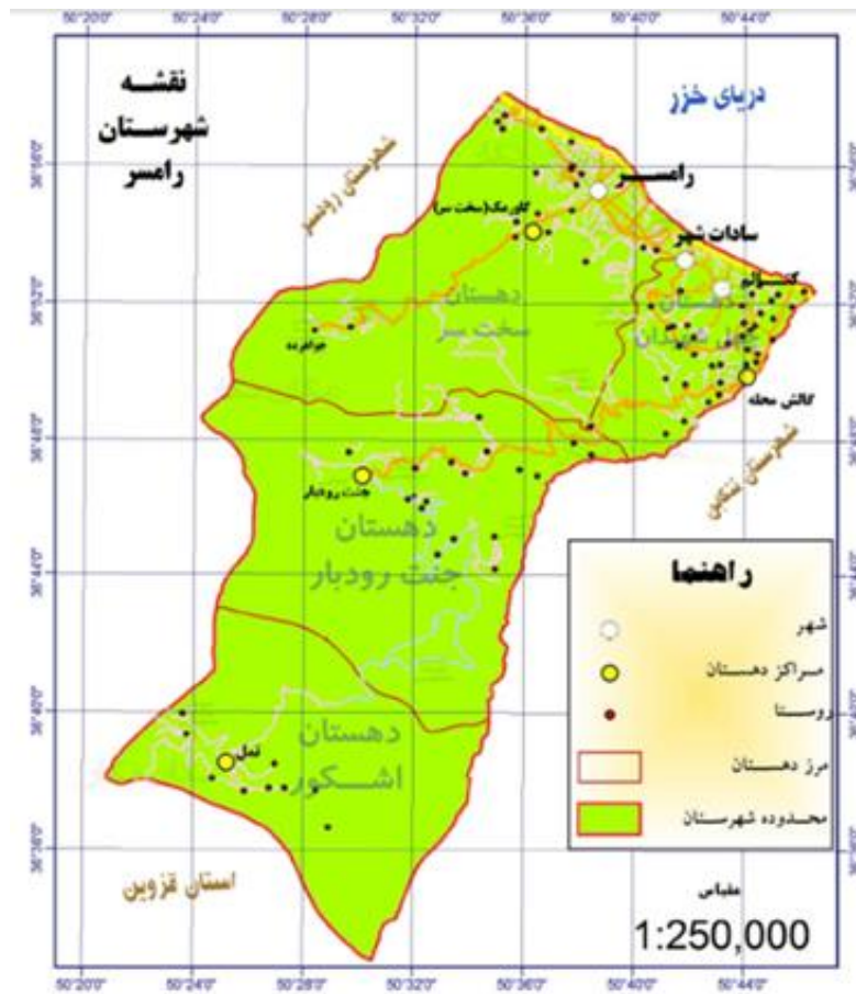
شکل ۱ موقعیت شهرستان رامسر

بود. از این سال به بعد تغییرات مهمی در آن صورت گرفت و هم‌اکنون این شهر تاریخی از بهترین