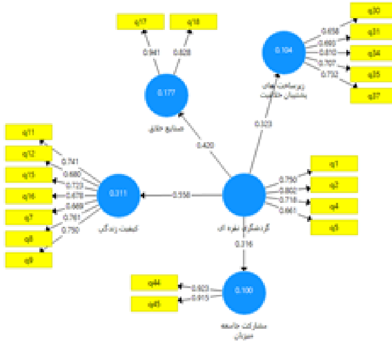
شکل ۲ ضرایب ساختاری مدل