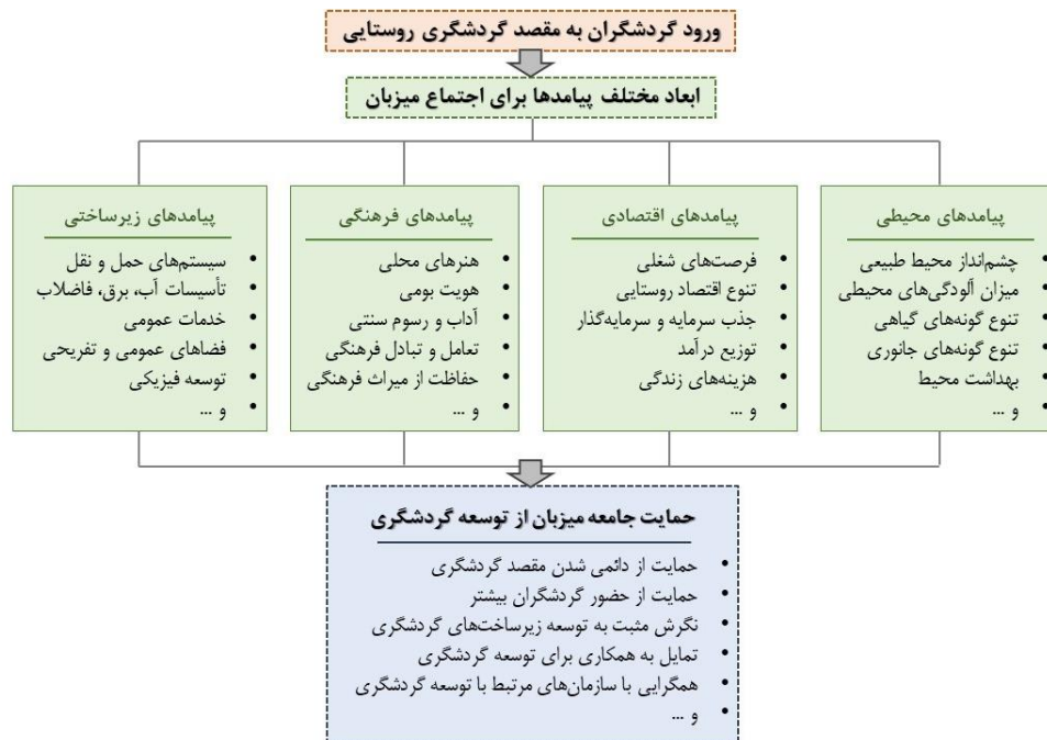
شکل ۱- چارچوب مفهومی پژوهش

با عنایت به مباحث نظری و پیشینه‌های عملی بررسی شده می‌توان اذعان نمود که بخش زیادی از رویکردهای حاضر در این موضوع مربوط به نگرش