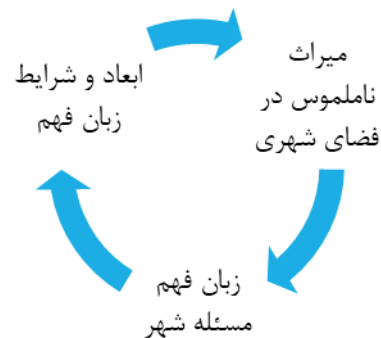
نمودار ۱. میراث ناملموس به‌عنوان یک زبان

تحقیقات فراوانی به اهمیت میراث ناملموس به‌عنوان یک مسأله شهری و به‌عنوان بخشی از مسأله میراث در ساختار شهری اشاراتی داشته‌اند اما تحقیقات کمتری به جوهره و ماهیت این مسأله به‌عنوان یک زبان فهم پرداخته‌اند (نمودار ۱). از این‌رو ضمن تلاش برای توسعه فهم انتقادی از مسأله شهری، بررسی جامع و انتقادی از تعامل دوسویه بین شهرنشینی و میراث ناملموس فرهنگی و استخراج نتیجه‌گیری‌های نظری و بسط مفهومی میراث ناملموس شهری با تأکید بر حفظ تنوع فرهنگی در محیط‌های شهری مورد توجه بوده است.