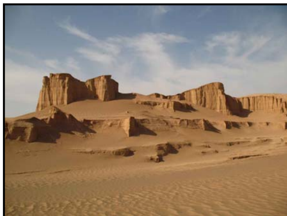
شکل ۶: کلوت‌های واقع در مجاورت منطقه مورد مطالعه

یاردانگ‌ها اغلب در رسوبات نرم دریاچه‌ای گذشته به وجود می‌آیند و اشکال تپه‌های فرسایشی حاصل فرسایش بادی یاردانگ‌ها در مناطق خشک دنیا از قبیل ایران، ایالات متحده، چاد، مصر، و پرودر سطح وسیعی گسترش یافته‌اند و فرآیندهای موجود تا حدی مورد مطالعه قرار گرفته‌اند (احمدی، ۱۳۷۷).