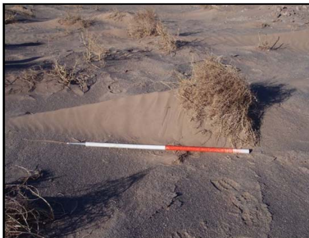
شکل ۲: پیکان‌های ماسه‌ای تشکیل شده در پشت بوته‌های گیاهی در منطقه مورد مطالعه