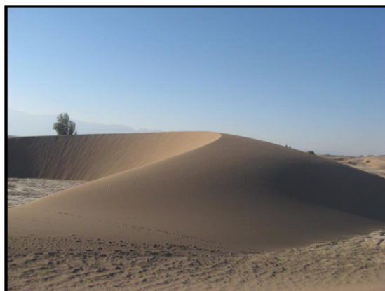
شکل ۵: برخان در منطقه مورد مطالعه (مجاور روستای حجت آباد)

یکی از فراوان‌ترین و مشخص‌ترین چهره‌های تراکم ماسه، تپه‌های هلالی شکلی هستند که در بیابان‌های ترکستان به برخان و در ایران به پیکرا شهرت دارند. این تپه‌ها هلالی شکل‌اند و کم و بیش متحرک می‌باشند. انتهای هلال به صورت رو به باد و در جهت بادهای مواد آن کشیده شده‌اند. نیمرخ عرضی برخان قوسی شکل و متقارن است (شکل ۵). در حالی که نیمرخ طولی آن در امتداد باد کلاً نامتقارن می‌باشد. دامنه رو به باد شیب یکنواخت و ملایمی دارد، اما دامنه پشت به باد پرتگاه مشخصی دارد که بین دو بازوی برخان قرار دارد (محمودی، ۱۳۶۷: ۸۸).