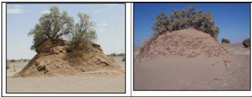
شکل ۴: نیکای گر با ارتفاع ۱۱ متر