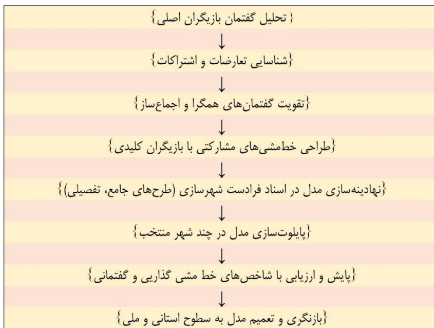
شکل شماره ۳. نمودار گام‌های اجرایی مدل خط‌مشی‌گذاری شهرسازی