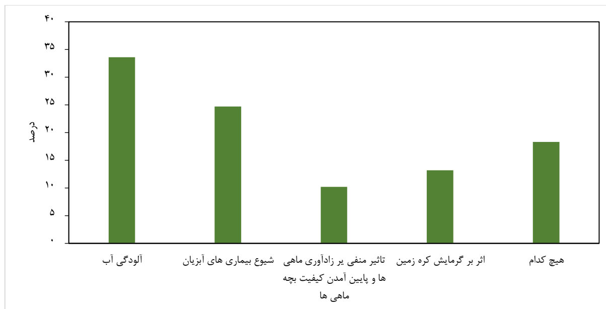
شکل ۳. سؤالات آگاهی محیط زیستی در خصوص تأثیرات استخرهای پرورش میگو