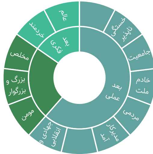
شکل ۱: شبکه مضمونی الگوی مدیریت اجرایی در سیره شهید رئیسی از منظر امام خامنه‌ای (مدظله العالی)