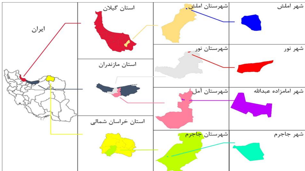
شکل ۱ موقعیت جغرافیایی شهرهای مورد بررسی در کشور و استانها

شهرهای منتخب در این مطالعه عبارتند از: شهر املش (استان گیلان)، شهرهای نور و امامزاده عبدالله (استان مازندران) و شهر جاجرم (استان خراسان شمالی). موقعیت جغرافیایی آنها در شکل ۱ و برخی