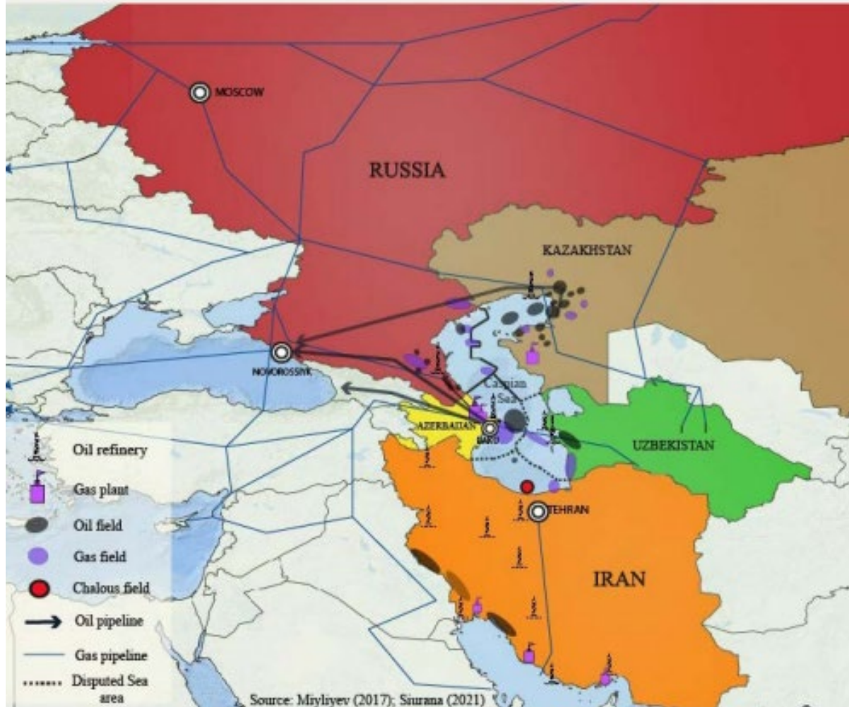
Map 1: Oil and gas in the Caspian region and beyond. Self-elaboration.

نمودار ۲ مسیرهای انتقالی نفت و گاز از مسیر ایران و روسیه (Miguel, 2022:8).